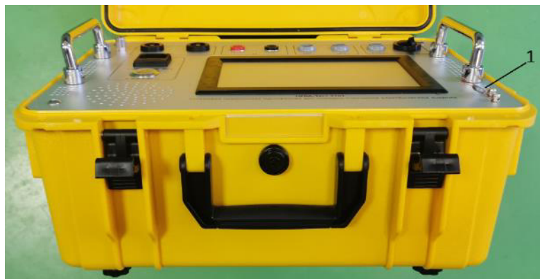
Рисунок 3 – Место нанесения знака поверки (1)