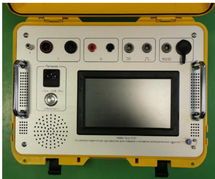
Рисунок 2 – Панель управления установки переносной однофазной для поверки счетчиков электрической энергии НЕВА-Тест 3101

Общий вид установок, панель управления и схема пломбировки представлены на рисунках 2 и 3. Знак поверки наносится давлением пломбира, лазерной гравировкой или иным способом на пломбу, расположенную на крепежных винтах панели управления установки в соответствии с рисунком 3. Заводские номера в цифровом формате, идентифицирующие каждую установку, наносятся на щиток, закрепленный боковой панели корпуса установки типографским способом в соответствии с рисунком 4.