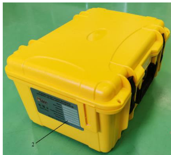
Рисунок 4 – Корпус установки переносной однофазной для поверки счетчиков электрической энергии НЕВА-Тест 3101, обозначение места нанесения заводского номера (2)