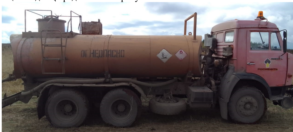
Рисунок 1 – Общий вид АЦ